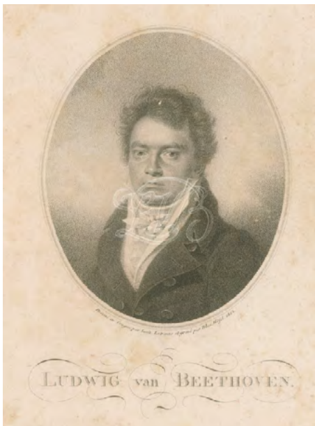
Ludwig van Beethoven, 1814. Grabado de Blasius Höfel a partir de un dibujo de Louis Letronne.

Los contundentes acordes en modo menor que se escuchan en la introducción nos sumergen tanto en un contexto marcial como en la solemnidad del ámbito cortesano mientras que el primer tema, constituido por un breve motivo inaugurado por los violines por sobre el dinámico y expectante acompañamiento de las cuerdas restantes, bien podría representar las aspiraciones de libertad que, una y otra vez, al ser replicadas por