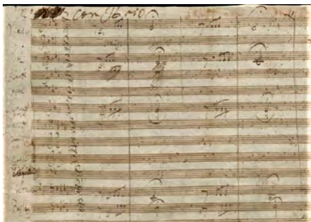
Ludwig van Beethoven. Sinfonía n.5 op. 67. Allegro con brio . Autógrafo.

como esta obra intrínsecamente abstracta viene a ser la trayectoria de ese motivo inicial, así como, humanizándolo, de las diversas vicisitudes que atraviesa, de los diversos temas que surgen a partir de él y de su metamorfosis, de su direccionalidad descendente inicial y el modo menor del cual partió a la gestualidad ascendente y el luminoso modo mayor con el cual concluye.