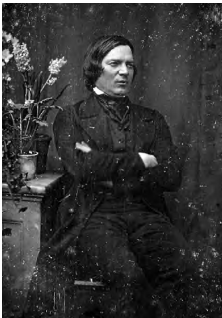
Robert Schumann en 1850. Daguerrotipo. Robert-Schumann-Haus, Zwickau.

Ese sector central de la obra, Langsam (Lento), se alza a un tiempo contemplativo y apasionado, cual un ensañador lied que emerge por sobre los pizzicati de las cuerdas presentando un magnífico dúo entre el solista del concierto y el violonchelista principal de la agrupación.